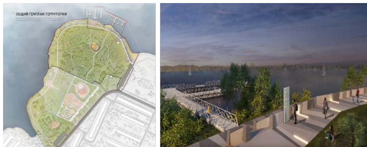
г. Десногорск, «АтомПарк 2-я очередь»

2018-2023 - 26 проектов-победителей благоустройства общественных территорий в городах расположения АЭС