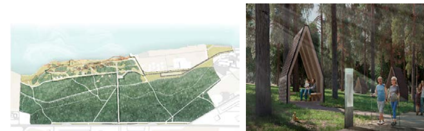
г. Заречный, «Эко-Парк Заречный»