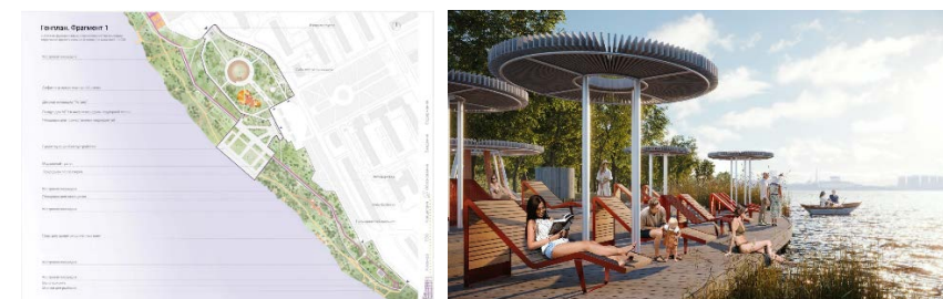
г. Нововоронеж, «Набережная»